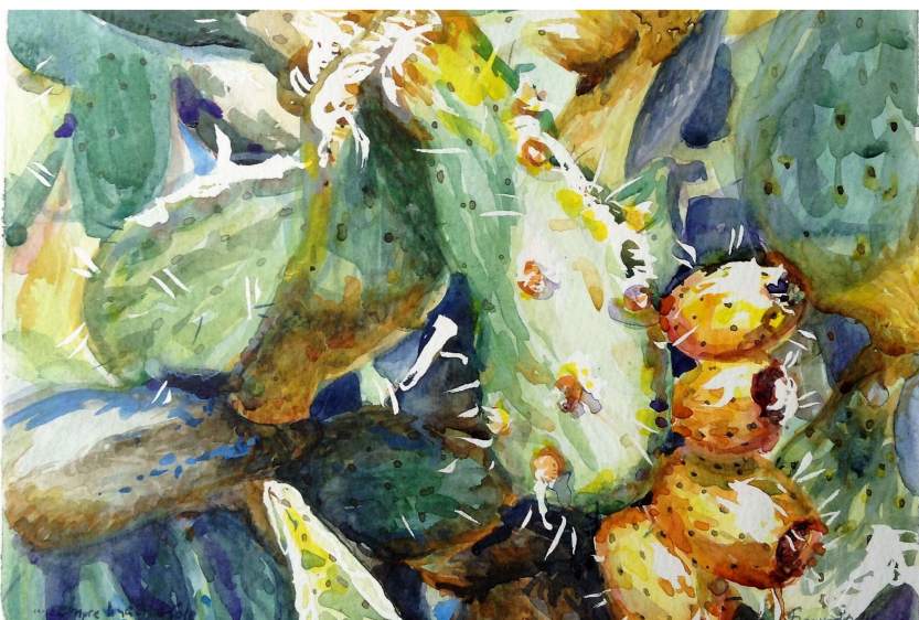
...SEMPRE BACIATI DAL SOLE - acquerello su carta 300g 30x22cm